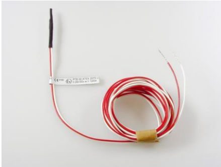
Figure : exécution selon ATEX (avec label ATEX)